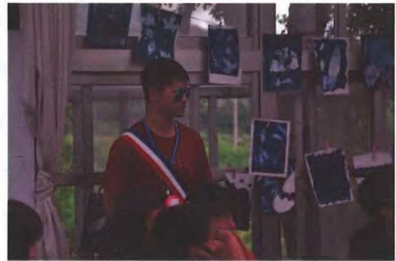
【圖示：國防大學志工】