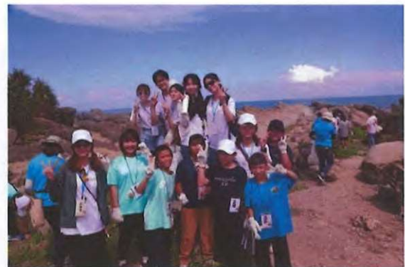
【圖示：校外教學暨淨灘活動留影】