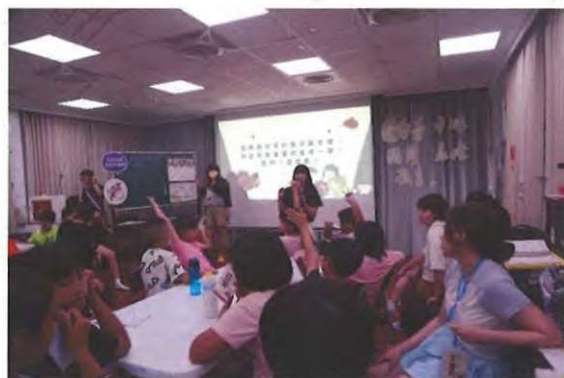
【圖示：廉潔教案授課情形】