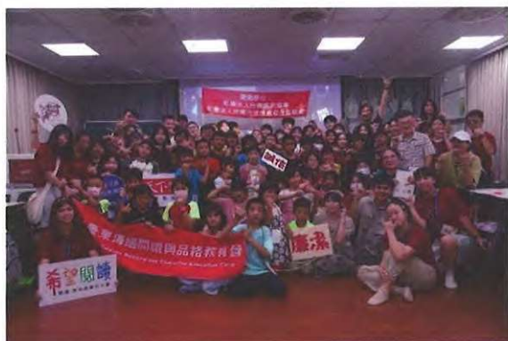
【圖示：閉幕式大合影】