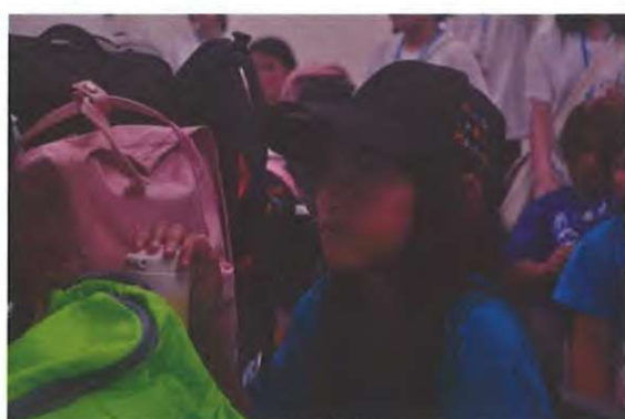
【圖示：學童認真參與課程】